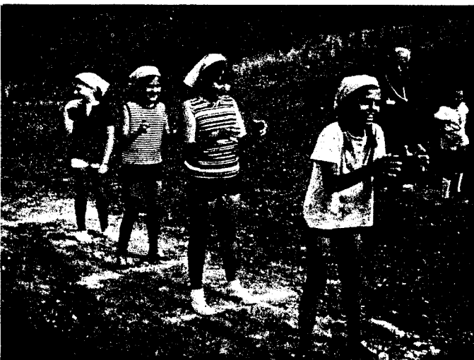
Старий Орел з новачками..