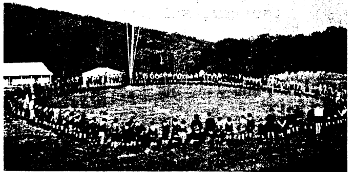
„Ми новацтвам у Пласті Молоді орлині діти..“