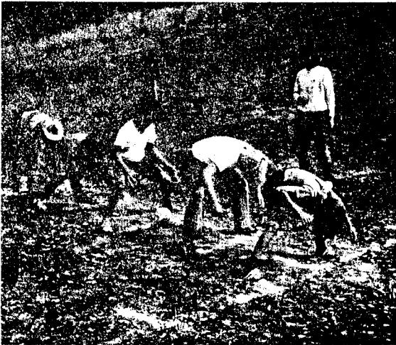
Впрсі вляють 5-ти змаг!