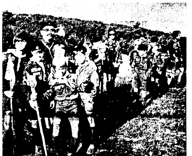
Бр. Міко з новаками..