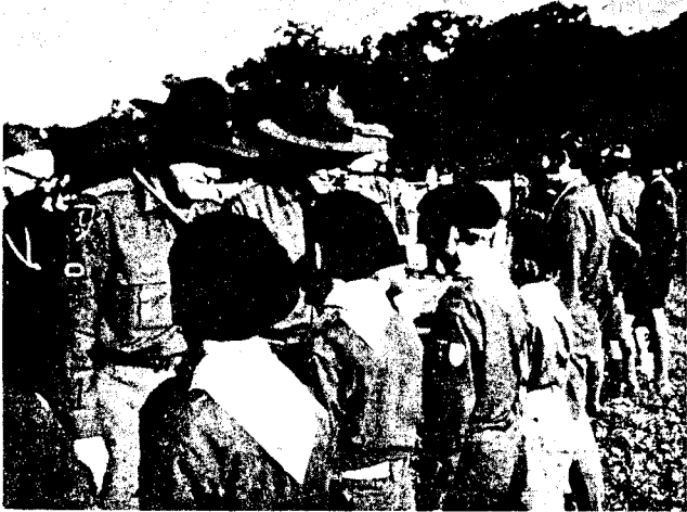
ЮМТЗ-Гороба ПТБ з новацтвам